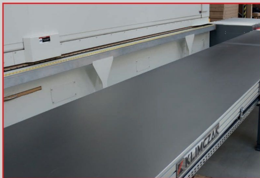
Stoły taśmowe w różnych szerokościach i długościach