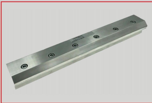
Perfekcyjne czyszczenie szczelin dzięki opcjonalnemu zespołowi noża powietrznego