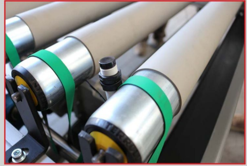
Zintegrowana automatyka maszyny pozwalająca na łączenie jej w linii z innymi urządzeniami