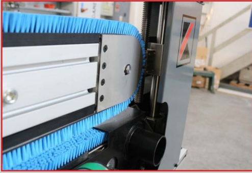
Zaawansowane mechanizmy regulacji wysokości